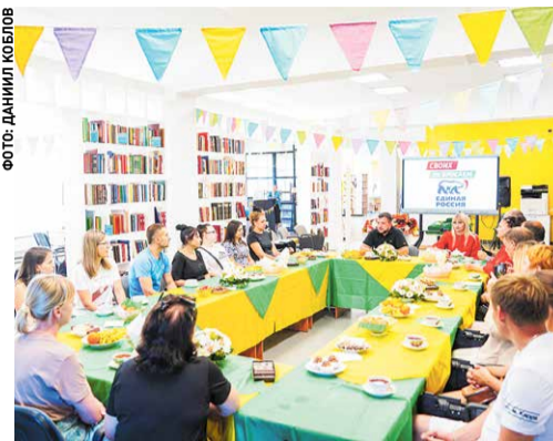
Все вопросы семей участников СВО обсудили за общим столом

В шатурской библиотеке прошла встреча с родными погибших военнослужащих на СВО. За чашкой чая обсудили волнующие вопросы, поговорили о планах на будущее. Для детей в это время организовали творческие мастер-классы.