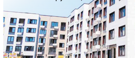
Дом на улице Свердлова в Рошале планируют сдать в эксплуатацию осенью

По окончании работ на площади высадят деревья и кустарники. Склоны СКЦ украсит вертикальное озеленение. Для того чтобы это пространство не использовалось зимой для катания на санках и ватрушках,