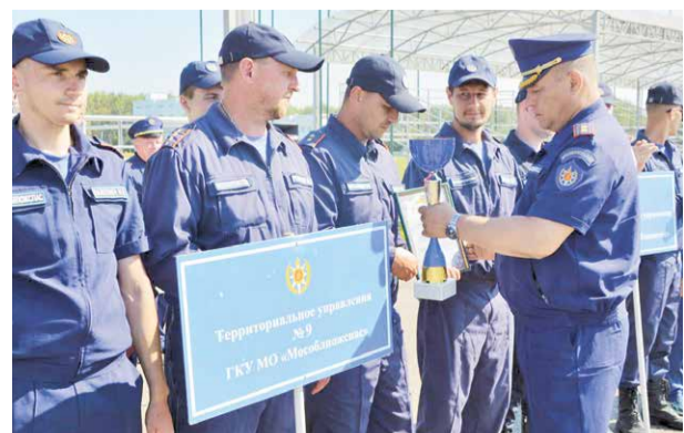
➤ Наши ребята лучше всех прошли дистанцию поисково-спасательных работ техногенного характера