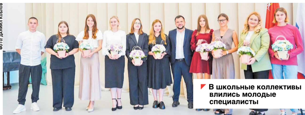
В школьные коллективы влились молодые специалисты

На педагогической конференции подвели итоги и задали новые цели