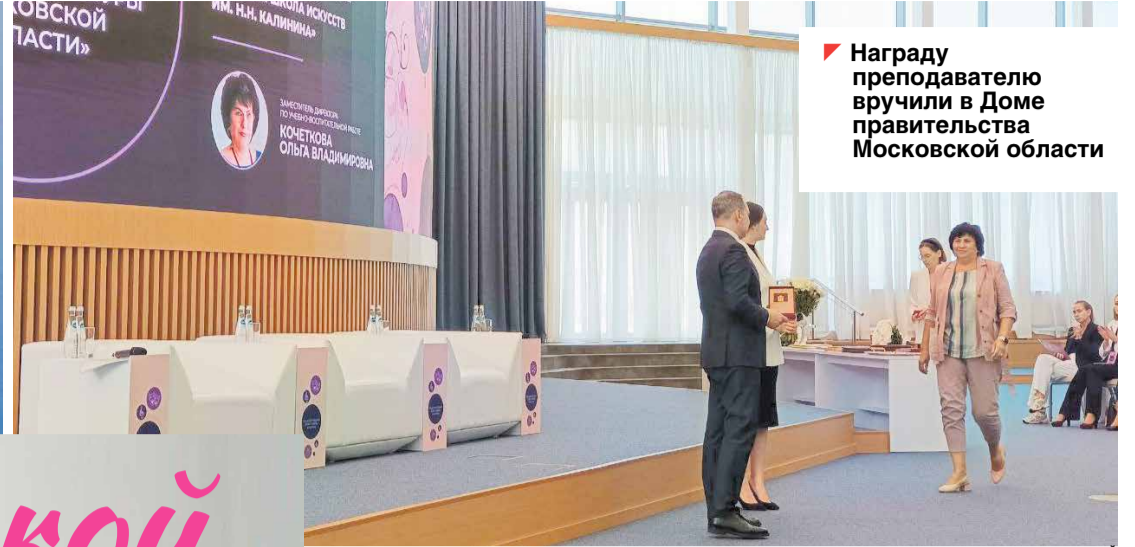
Награду преподавателю вручили в Доме правительства Московской области