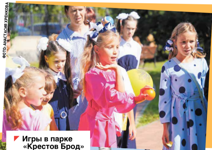
Игры в парке «Крестов Брод»

Мальчишки и девочки приняли участие в квестах и мастер-классах