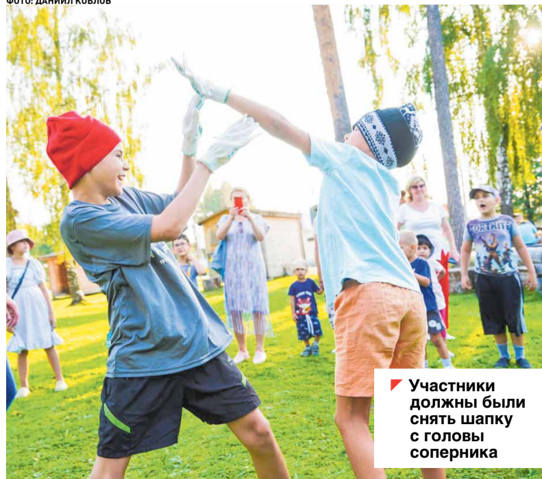
Участники должны были снять шапку с головы соперника