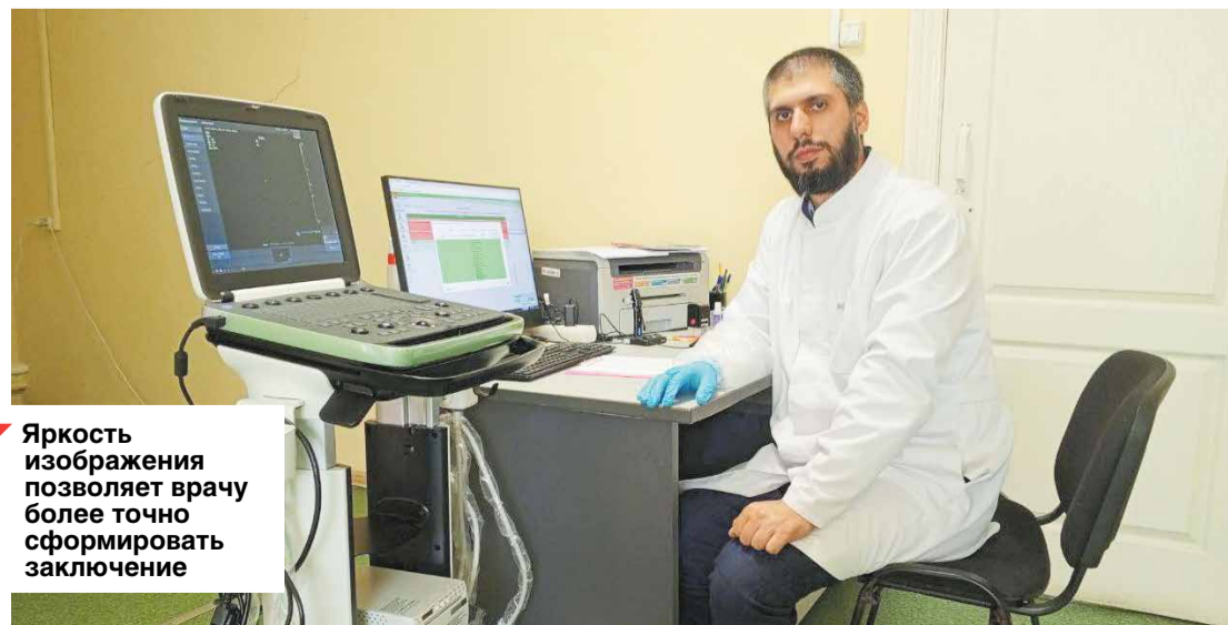
Яркость изображения позволяет врачу более точно сформировать заключение