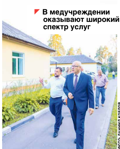
В медучреждении оказывают широкий спектр услуг