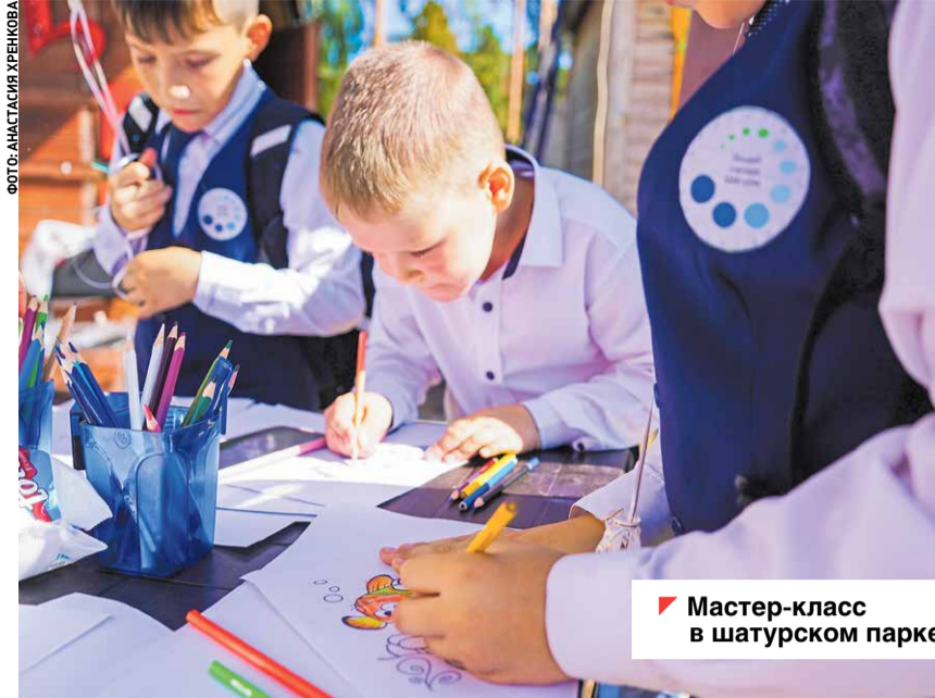
Мастер-класс в шатурском парке

Для мальчишек и девочек приготовили насыщен-